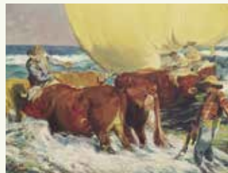
PINTURA EJERCICIOS Y RÉPLICAS SOBRE SOROLLA Y VAN GOGH

Del 6 al 27 de setembre. Inauguració dimecres 6 de setembre a les 19 h