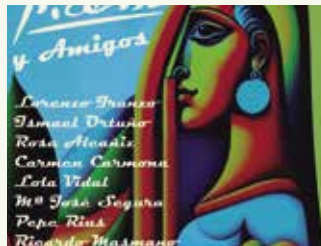
VARIS MUCHO QUE CELEBRAR Organitza: Canyada d'Art

de Juan Bleda Del 5 al 27 d'octubre. Inauguració dijous 5 d'octubre a les 19 h