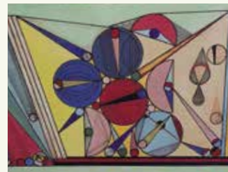
PINTURA COLOR de Manuel Lobato

Del 10 al 29 de novembre. Inauguració divendres 10 de novembre a les 19 h