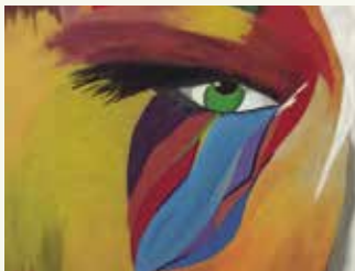
PINTURA HUELLAS EN EL CAMINO de Alicia Gómez

Del 6 al 27 de setembre. Inauguració dimecres 6 de setembre a les 19 h