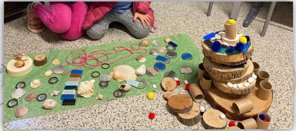
5. ARTS I MINIMONS