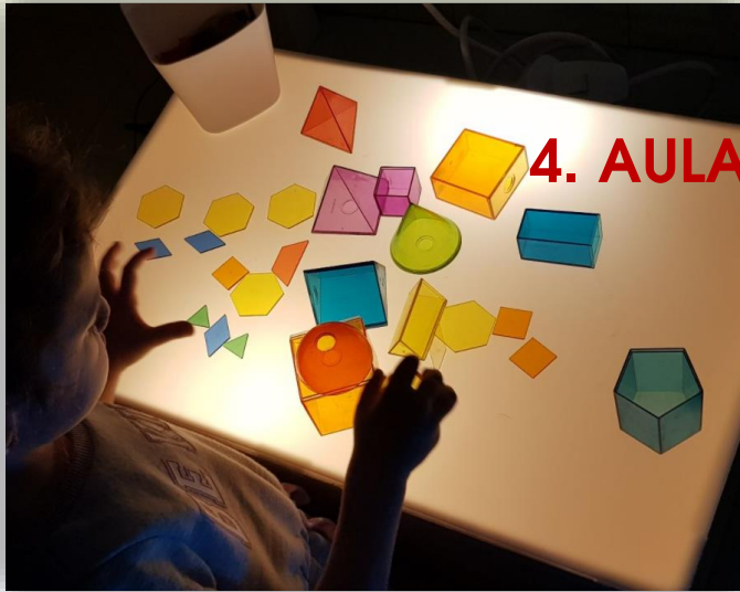
4. AULA DE LLUM